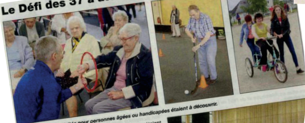
Une vingtaine d'activités pour personnes âgées ou handicapées étaient à découvrir.

Le Défi des 37 est une journée dédiée aux personnes âgées qu'elles soient en établissement d'hébergement ou non, aux personnes handicapées et aux personnes isolées. La quatrième édition, a eu lieu pour la deuxième fois à Renazé, salle omnisports et sur le stade Michel Le Millinaire. Les différents partenaires organisateurs (l'association aide accueil amitié Poncaeu Charmilles avec le centre intercommunal d'action sociale et la Maison familiale