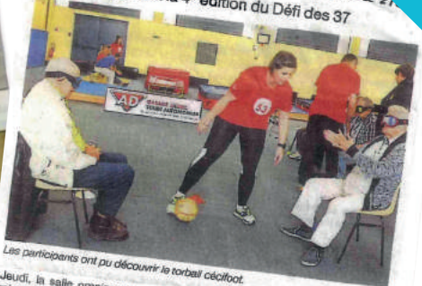
Les participants ont pu découvrir le torball céfifoot.

Judi, la salle omnisports et le terrain des sports ont accueilli près de 300 personnes âgées ou en situation de handicap, à l'occasion de la quatrième édition du Défi des 37, organisé par l'association Aide accueil amitié Poncaeu-Charmilles, de La Selle-Craonnaise, avec la participation du Centre intercommunal d'action sociale (CIAS) du Pays de l'Oudon et de la maison familiale de l'Oudon. Tout au long de la journée, vingt-trois activités étaient proposées : gymnastique, relaxation, vélos adaptés, jeux en bois, marche nordique, sarbacane... avec, cette