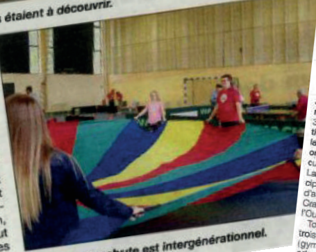
Le jeu du parachute est intergénérationnel.